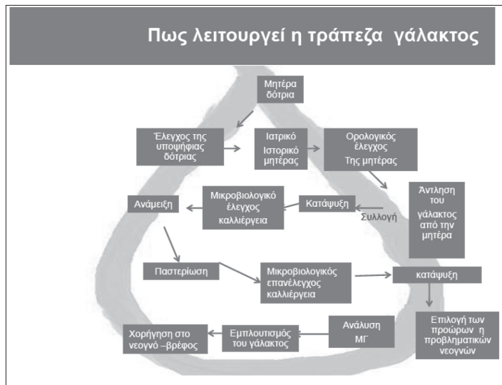
Διάγραμμα 3. Διάγραμμα Ροής Λειτουργίας Τράπεζας Μητρικού Γάλακτος

Η μέθοδος αυτή δύναται να καταστρέψει αποτελεσματικά παθογόνα μικρόβια και ιούς, που δυνητικά μπορούν να επιμολύνουν το μητρικό γάλα και ακολούθως να μεταδοθούν στο νεογνό. Συγκεκριμένα, η παστερίωση καταστρέφει τον ιό της επίκτητης ανοσολογικής ανεπάρκειας (HIV1 και HIV2), τον μεγαλοκυτταροϊό (CMV), τον ιό της ηπατίτιδας C και τον λεμφοτρόπο κυτταρικό ιό (T-lymphoma virus). Επιπροσθέτως με την παστερίωση καταστρέφονται μικρόβια όπως το μυκοβακτηρίδιο της φυματίωσης