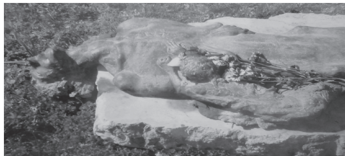
Εικόνα 1. Βρέφος που θηλάζει από το νεκρό σώμα της μητέρας του (Ταφικό Μνημείο από το 1ο Νεκροταφείο Αθηνών)

να θηλάζει το συγκεκριμένο νεογνό. Η μητέρα αυτή, καλούμενη ως «τροφός», που αναλάμβανε να υποστηρίξει το συγκεκριμένο νεογνό, ήταν συνήθως συγγενής. Σε πολλές περιπτώσεις η τροφός αναλάμβανε να σιτίσει το νεογνό έναντι αμοιβής. Η χρήση άλλης μητέρας σαν τροφού έγινε ιδιαίτερα συνηθισμένο φαινόμενο μεταξύ των βασιλικών οικογενειών αλλά και της αριστοκρατίας. Τον 18ο αιώνα στην Κεντρική Ευρώπη η πρακτική της χρήσης τροφού έλαβε διαστάσεις επιδημίας, όχι μόνον στους πλούσιους αλλά και στις φτωχότερες κοινωνικές τάξεις. Η μεγάλη ζήτηση τροφών, που με αμοιβή θηλάζαν ξένα παιδιά, έφερε γρήγορα πολύ σοβαρά προβλήματα στην σίτιση των νεογνών, τα οποία αύξησαν σημαντικά την νεογνική και βρεφική νοσηρότητα και θνησιμότητα. Από τις αρχές του 19ου αιώνα άρχισαν να δημοσιεύονται στα επιστημονικά περιοδικά αλλά και στον τύπο, ισχυρές ενστάσεις του τότε επιστημονικού κόσμου, σχετικά με την ασφάλεια που προσέφερε η χρήση τροφών στην σίτιση των νεογνών. Ενώ ταυτόχρονα πολλές από τις επαγγελματίες τροφούς θηλάζαν μεγάλο αριθμό παιδιών εγκαταλείποντας τα δικά τους. Αξιοσημείωτο είναι ότι πολλές από αυτές τις επαγγελματίες τροφούς, κατανάλωναν μεγάλη ποσότητα καπνού ή και οινοπνεύματος. Είχε φτάσει πλέον η ώρα της δημιουργίας των Τραπεζών Μητρικού Γάλακτος 20-25 .