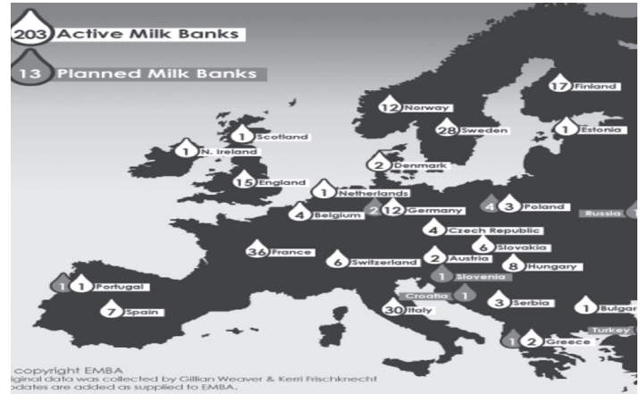
Εικόνα 2. Οι Τράπεζες Μητρικού Γάλακτος στην Ευρώπη

Η χώρα μας, όπως και άλλες Ευρωπαϊκές χώρες, παρά το γεγονός ότι ήταν πρωτοπόρος στην ίδρυση μιας Τράπεζας Γάλακτος παραμένει ουραγός στην δημιουργία νέων Τραπεζών Γάλακτος.