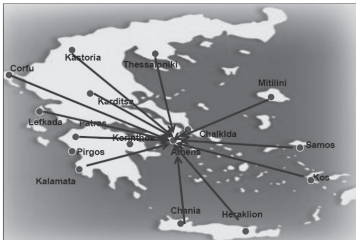
Εικόνα 3. Περιοχές από όπου προέρχονται οι δότες μητρικού γάλακτος Ποιοτικός Έλεγχος και Διασφάλιση Καταλληλότητας μητρικού γάλακτος στις δύο Τράπεζες Γάλακτος που είναι σε πλήρη ανάπτυξη στη χώρα μας

ρωθεί ένα σύντομο ερωτηματολόγιο με μια προσωπική συνέντευξη της μητέρας από τη μαία της Τράπεζας Γάλακτος, που περιλαμβάνει τα στοιχεία που αναπτύσσει ο πίνακας 4. Παρά το γεγονός ότι ο μεγαλοκυτταροϊός (CMV) καταστρέφεται με την παστερίωση, στην τράπεζα γάλακτος του Μαειτηρίου «Έλενα Ε. Βενιζέλου», ως επιρόσθητη δικλείδα ασφαλείας, απορρίπτονται δείγματα θετικά στον CMV. Εν τούτοις, λόγω του χαμηλού δείκτη φυματιώδους επιμόλυνσης στην χώρα μας, οι δότες δεν ελέγχονται για την πιθανότητα λοίμωξης από φυματίωση.