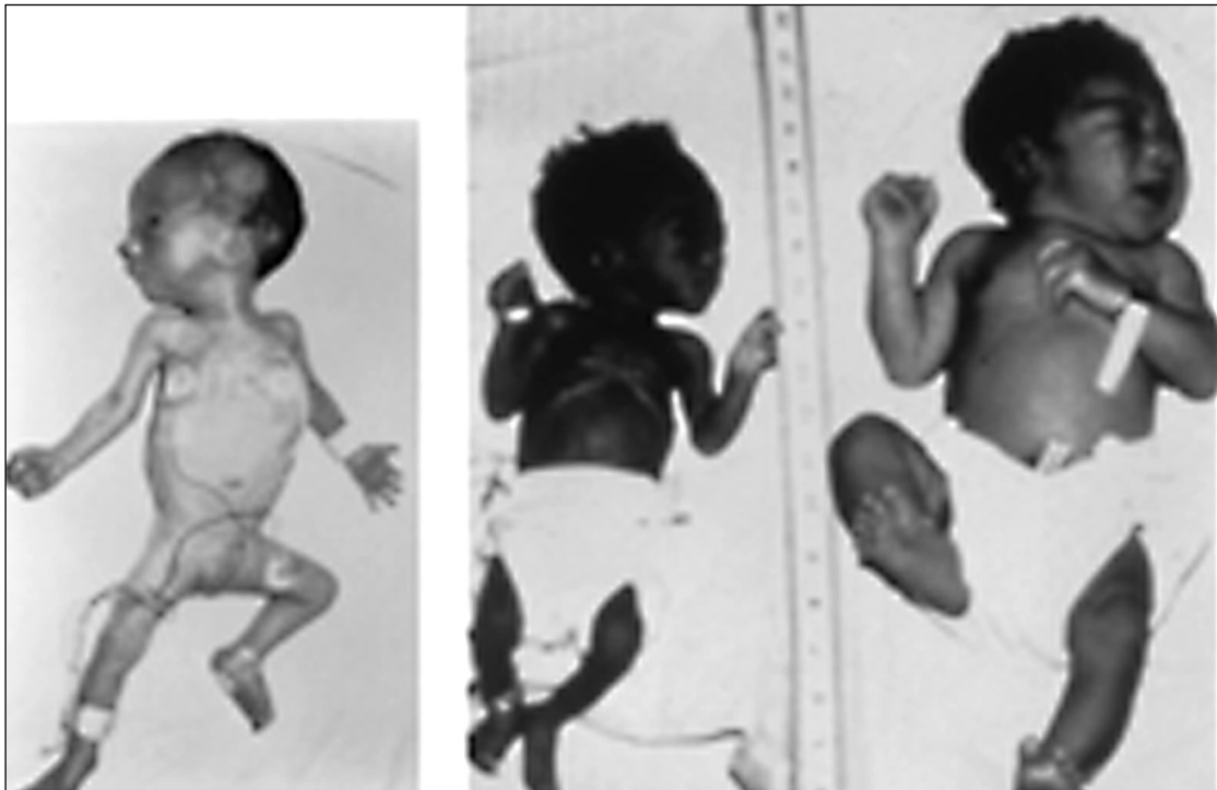
Εικόνα 1: α) Πρόωρο και δυστροφικό νεογνό 34 εβδομάδων κύησης, β) Νεογνό 39 εβδομάδων με σοβαρή καθυστέρηση της ανάπτυξης, γ) Νεογνό με κανονική ανάπτυξη 40 εβδομάδων κύησης.

Η τρίτη κατηγορία περιλαμβάνει νεογνά που παρουσιάζουν σε μεγάλο βαθμό ιδιαίτερα προβλήματα. Τα προβλήματα αυτά εμφανίζονται είτε αμέσως μετά τη γέννηση, όπως η περιγεννητική ασφυξία, η υπογλυκαιμία, και η υποθερμία, είτε πολύ αργότερα, ακόμα και πολλά χρόνια μετά την ενηλικίωση. Η παγκόσμια Οργάνωση Υγείας αλλά και οι περισσότεροι ειδικοί που ασχολούνται με την αύξηση του εμβρύου, του νεογνού και του βρέφους θεω-