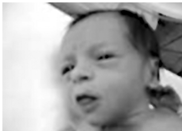
Εικόνα 4: Χαρακτηριστική κλινική εικόνα νεογνού με ήπια ή μέτρια ενδομήτρια δυστροφία. Απεικονίζεται το χαρακτηριστικό ζωηρό βλέμμα που παρουσιάζουν τα νεογνά αυτά

Η υπογλυκαιμία είναι ένα από τα συχνότερα προβλήματα που παρουσιάζουν τα νεογνά με ενδομήτρια δυστροφία. Όσο σοβαρότερη είναι η ενδομήτρια δυστροφία τόσο μεγαλύτερος ο κίνδυνος να εμφανίσει το νεογνό υπογλυκαιμία. 21 Ο κίνδυνος αυτός είναι μεγαλύτερος τις πρώτες τρεις ημέρες της ζωής εικόνα 4. Υπογλυκαιμία όμως με ή χωρίς κετοναίμια, πριν από τα γεύματα μπορεί να εμφανίζεται ακόμα και εβδομάδες μετά την γέννηση. Στο φυσιολογικό νεογνό, τις πρώτες ώρες μετά τη γέννηση, η γλυκογονόλυση αποτελεί την κυριότερη πηγή γλυκόζης. Τις επόμενες ώρες όταν τα αποθέματα γλυκογόνου αρχίζουν να εξαντλούνται, η παραγωγή γλυκόζης στα φυσιολογικά νεογνά εξασφαλίζεται με την κινητοποίηση του γαλακτικού οξέως και με μετατροπή των αμινοξέων σε γλυκόζη (γλυκονεογένεση). Τα IUGR νεογνά δεν μπορούν να μετατρέψουν τα αμινοξέα σε γλυκόζη. 22 Η πειραματική χορήγηση φαινυλαλανίνης στη διάρκεια υπογλυκαιμίας, που είναι το κλειδί στη διαδικασία